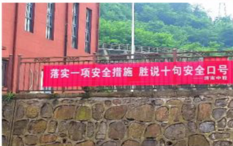
生产现场悬挂安全条幅